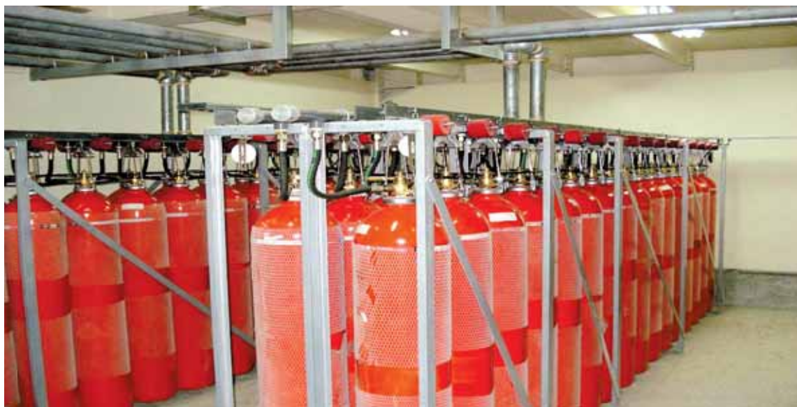
شکل ۳- مجموعه سیلندرهای اطفای حریق اتوماتیک CO 2 با متعلقات

هنگام محاسبه و طراحی سیستم‌های با گازهای هیدروکربنی (چون FM200 یا NOVEC) می‌بایست نکات مهمی مد نظر قرار گیرد؛ از جمله اینکه برخلاف گازهای ساکن زمان تخلیه نباید از ده ثانیه بیشتر شود تا از تولید رادیکال‌ها جلوگیری شود. در صورت واکنش، هیدروژن فلوراید (HF) به‌عنوان محصول تجزیه تولید شده که به نوبه خود در مجاورت آب و یا رطوبت محیط، ماده بسیار