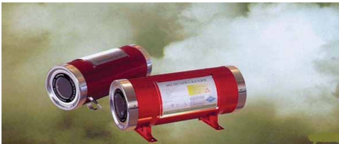
شکل ۶- سیستم اطفای اتوماتیک آبروسل پودر در حال عملکرد

انباره‌های مواد یخ زده از جمله این اماکن هستند. سیستم‌های تقلیل غلظت اکسیژن را نمی‌توان در موارد ذیل به کار برد: ● در سیستم‌های زباله‌سوز که اکسیژن مورد نیاز برای احتراق در خود مواد موجود است. ● هنگامی که فرآیند احتراق اگزوترمیک که نیازی به اکسیژن ندارد رخ می‌دهد. ● و یا هنگامی که فرآیندهای کاتالیتیک رخ می‌دهد. دستورالعمل Vds ۳۵۲۷ را می‌توان به‌عنوان یکی از روش‌های کاربرد سیستم‌های تقلیل غلظت اکسیژن به کار برد.