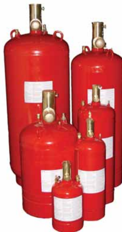
شکل ۵- نمونه‌ای از سیلندره‌های اطفای اتوماتیک با گاز NOVEC

فوم‌های اطفای حریق از سال‌ها پیش به منظور مقابله با حریق مایعات مخلوط شدنی با آب (الکل، کتون، و غیره) یا مایعات غیر قابل اختلاط با آب (هیدروکربن‌ها) مورد استفاده قرار گرفته‌اند.