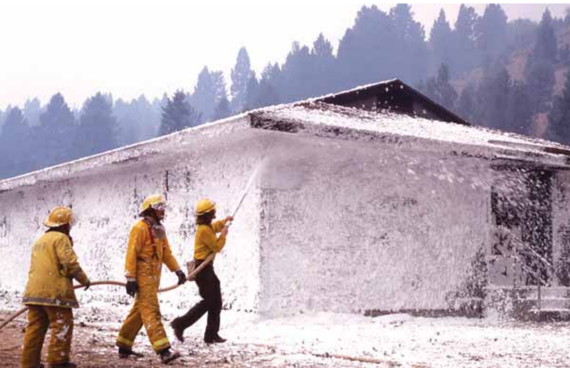
شکل ۴- کاربرد سیستم اطفای حریق فوم

این فومها با پایه آب بوده و هوا بخش عمده‌ای از آنها را تشکیل می‌دهد.